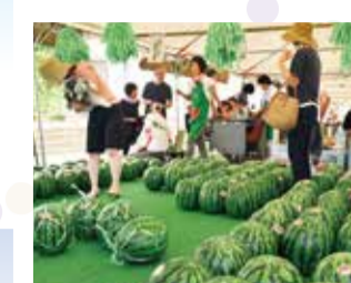
八色スイカまつり 有名ブランド「八色スイカ」が産地価格で買える人気企画。おしいスイカにみんだ満足です。 ●025-788-0253 (あぐりばー八色) ●7月下旬~8月上旬 あぐりばー八色