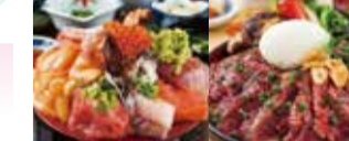
南魚沼・本気丹 南魚沼の食文化の宝庫「南魚沼コシヒカリ」のおいしさを本気で取り組む大好評の丼チェーン。南魚沼コシヒカリの上に各店舗一押しのお肉を乗せ「大盛り」にし、様々な工夫でご提供いたします。南魚沼の「本気」を味方にしてください。※期間限定のキャンペーンです。