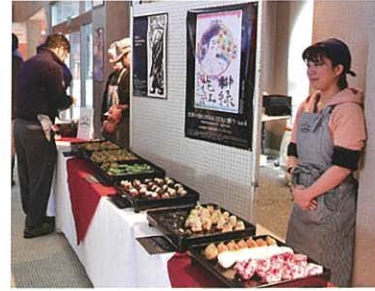
Vol. 4 会場風景