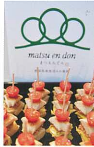
料理は農家レストラン「まつえんどん」(南魚沼市美佐島)